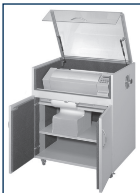
Schalldämmschrank mit Drucker PP 405 und Papierstapel