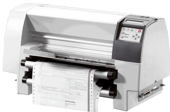
PP 803 / PP 803C avec coupe-papier intégré

La PP 803 est une imprimante matricielle compacte à haute performance. Son design particulièrement robuste et sa technologie à plat offrent la sécurité de fonctionnement demandée dans des applications professionnelles. Tout cela profite surtout à l'impression des formulaires. Le contrôle automatique de l'épaisseur du papier (AGC) permet d'imprimer des formulaires jusqu'à une épaisseur de 1 mm.