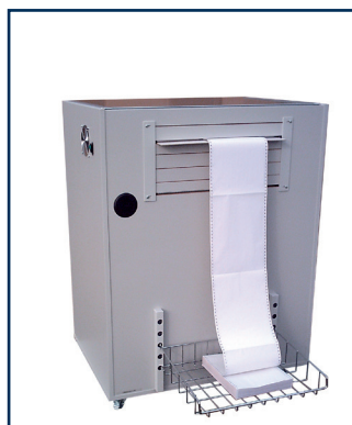
Schalldämmschrank PP 407 / PP 408 mit Papierablage