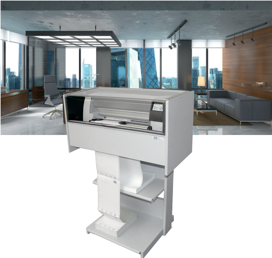
PP 806 mit den Optionen Schalldämmhaube S/SC 05 und Standfuß

Die neue Schalldämmhaube S/SC 05 in Kombination mit dem Druckertisch ist die professionelle Lösung für maximale Druckleistung bei minimaler Geräuschkentwicklung in der Anwendung mit dem Hochleistungsdrucker PP 806 oder PP 809.