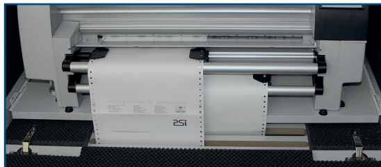
Zwei Getrennte Papierzuführungen (Bild zeigt PP 809 in Schalldämmhaube)