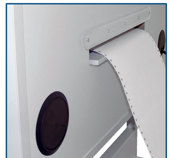
Rückseite mit Abreißschiene und Abdeckungen für Kabelschächte